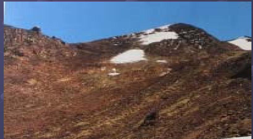
Nevado Chacaltaya 2007

Sin embargo su derretimiento por efectos del calentamiento global ha sido acelerado. De continuar el deshielo de nuestros nevados sentiremos escases de agua para consumo humano, agricultura y generación de energía eléctrica.