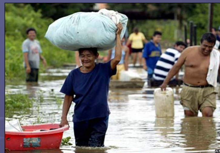
Las peores inundaciones en 25 años. Más de 3.500 personas afectadas