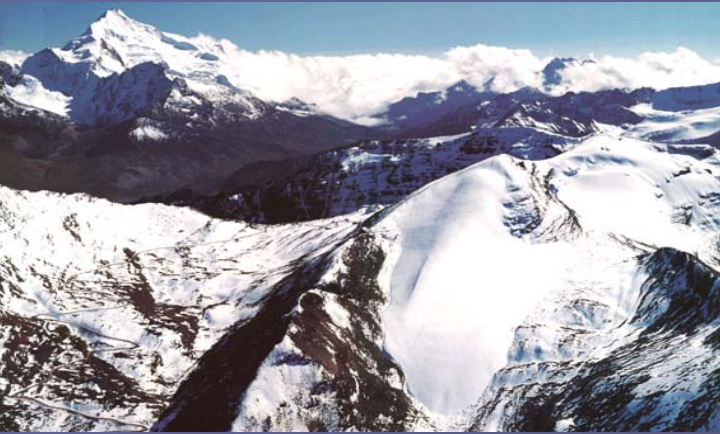
Nevado Chacaltaya 1997

En los últimos años se ha sentido con mayor fuerza los efectos del cambio climático en Bolivia, por un lado con el deshielo de algunos nevados como el del Chacaltaya, que en 1998 se anuncio su desaparición en 15 años o más.